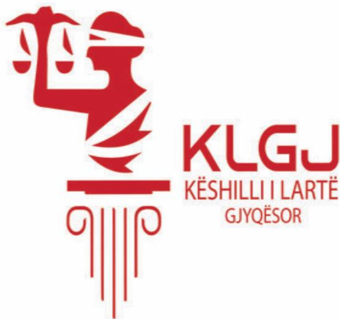
TABELA E PËRMBAJTJES